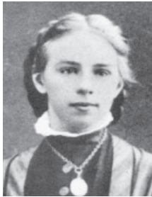
Emilie Kempin-Spyri, 1885

Die Nichte von «Heidi»-Johanna Spyri begann mit 32 Jahren als Mutter dreier Kinder an der Universität Zürich als erste Schweizerin ein Jura-Studium und promovierte 1887 als erste Schweizer Juristin. Die Verweigerung des Anwaltspatents als auch einer Anstellung als Privatdozentin aufgrund ihres Geschlechts zwang sie, mit ihrer Familie nach New York auszuwandern, wo sie eine Rechtsschule für Frauen gründete und die Zulassung von Frauen zum Rechtsstudium und zur Advokatur bewirkte. 1891 aus familiären Gründen zurück in der Schweiz, wurde sie als erste Privatdozentin an der Universität Zürich zugelassen. Daneben war sie als selbstständige Rechtsberaterin tätig, erteilte Rechtsunterricht für Laien